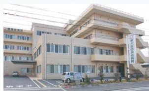
東大阪徳洲会病院