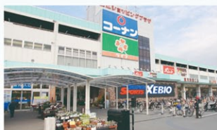
コーナン東大阪菱江店