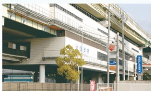
近鉄けいはんな線「吉田」駅