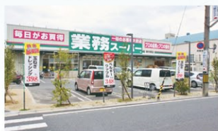
業務スーパー東大阪店