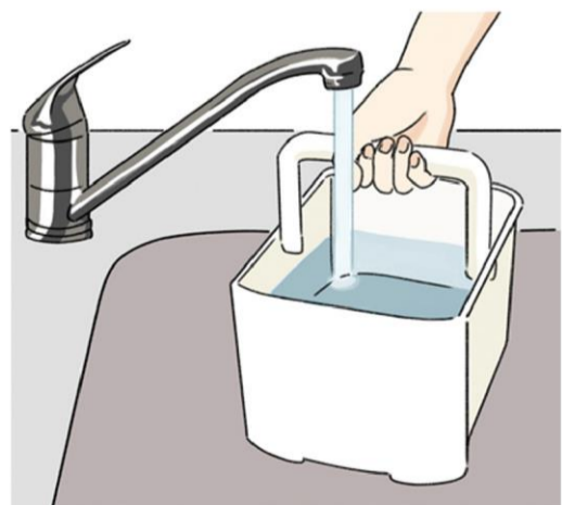
どのタイプの加湿器も、水道水を使いましょうね

置く高さも重要で、湿気は、下に貯まりやすいので、床から50センチ〜1メートルの高さが良いそうです。