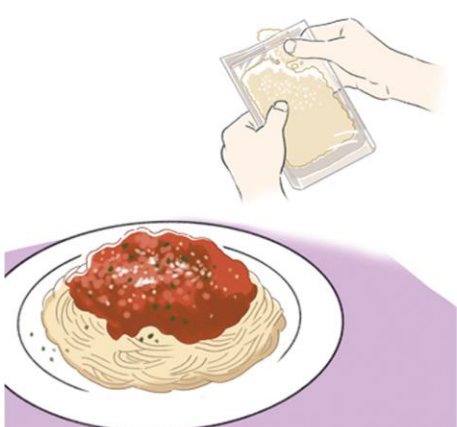
刻みニンニクは、パスタやカレーにも重宝します！

料理はすぐ出せるもの 使えるものを常備 毎日の料理で副菜を考えたとき、簡単に食べられるものをとり入れてみては？ たとえば、豆腐は切っただけ。切るのが面倒なら、スプーンでざっくり取り分けても十分です。また、納豆もしらすやキムチ、ネギなどを和えるだけで立派な一品に。ちくわやカニかまぼこ（通称カニカマ）もあると便利。ちくわはキッチンバサミでも切れますし、カニカマは手でさくだけ。手でちぎったプロセスチーズと和えて出すだけで副菜になります。仕上げにマヨネーズやドレッシングなどをかければOK。 副菜に役立つものを常備するのもグッド。市販の甘酢で野菜を漬ければ色々使えます。おすすめは、刻みシヨウガやキュウリ。刻みシヨウガは、